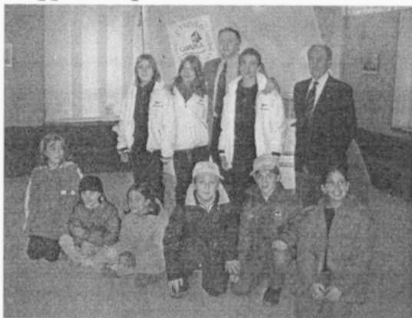
I ragazzi della squadra agonistica del DvV davanti all'Optimist vinto al Carivela