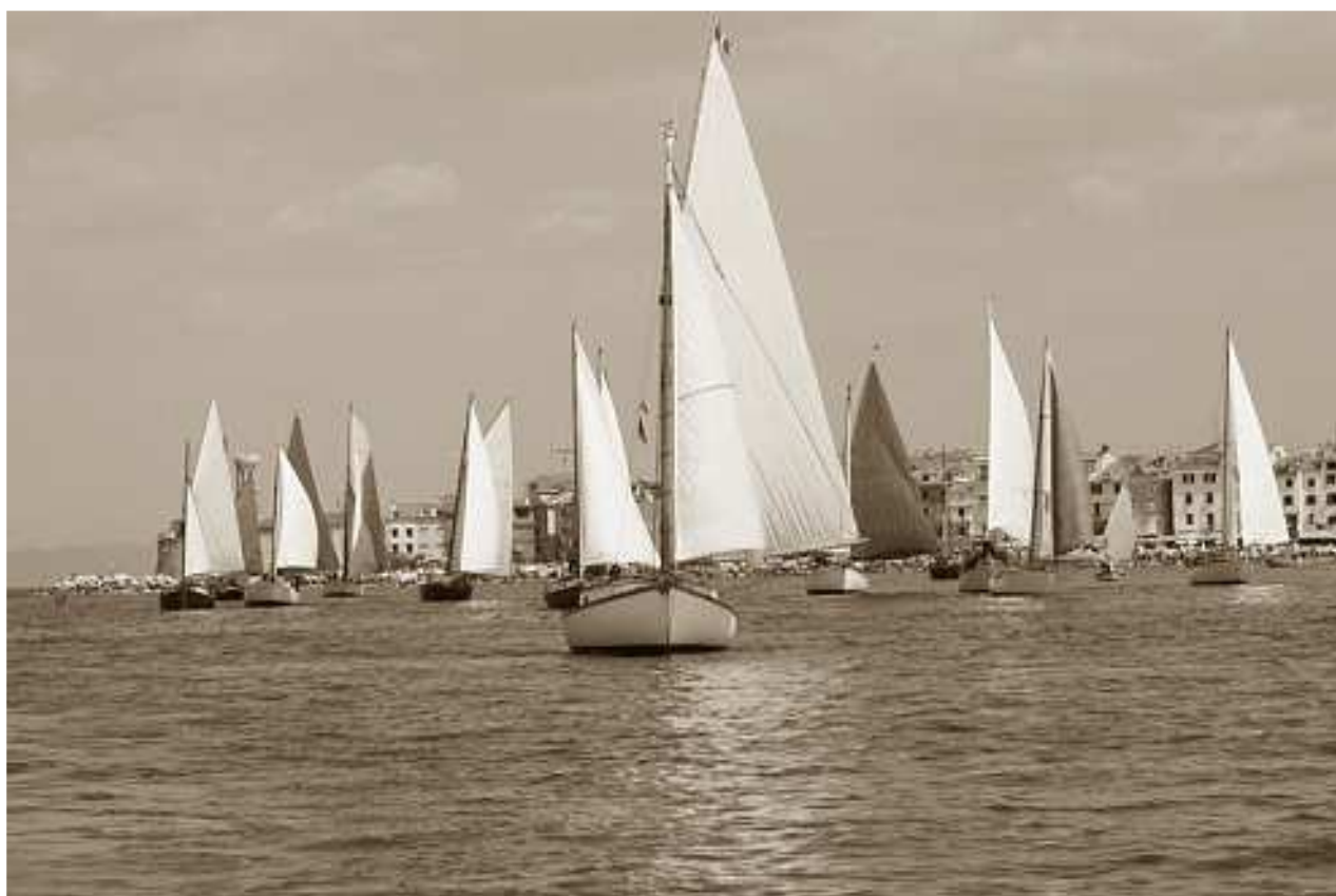
Cassiopea alla partenza della regata di Pirano