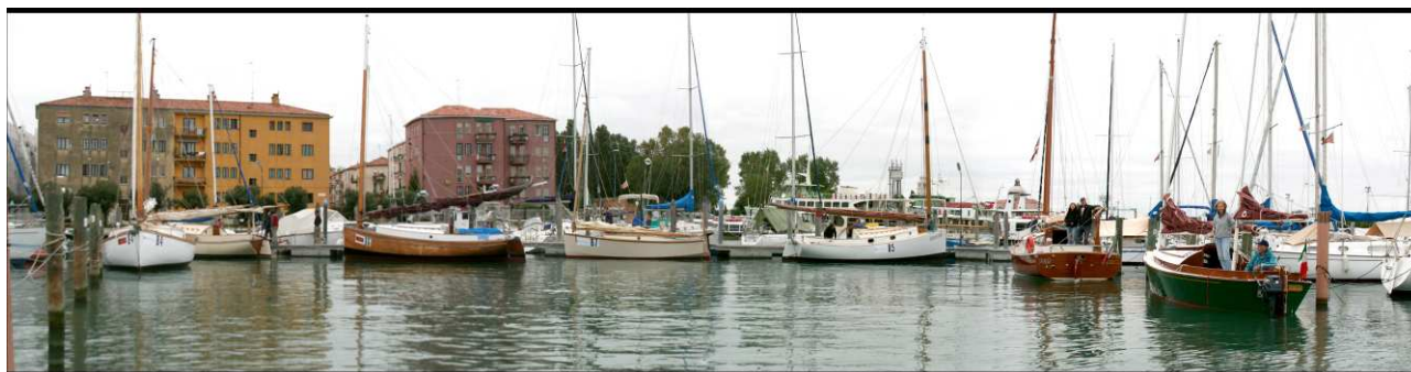
Da sinistra: Cassiopea, Catone, Chirone, Foschia, Margherita, Mili e Siton.