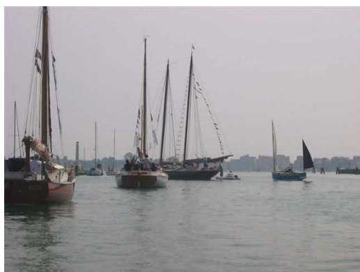
L’inizio della sfilata

Durante il raduno siamo stati allietati dal gruppo di danza e musica popolare, i Nanabò che ci hanno intrattenuto con canti e balli fino a tarda sera, coinvolgendo passanti e turisti che erano presenti in piazza Vigo, il salotto buono di Chioggia.