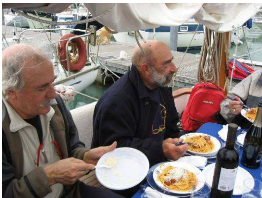
Il v. Presidente e... "l'Imperatore dei catboaters"

Mili, El Barbanane Niovo e Cassiopea stavano già per affilare le proprie armi... si sa, metti due barche che navigano per la stessa rotta, e queste si ingaggiano subito in una regata. Purtroppo un avviso della Protezione Civile ci ha indicato lo stato di allerta meteo