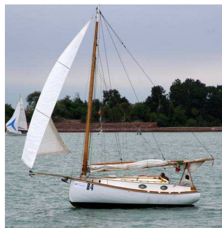
La sconsolata Cassiopea

La prova di sabato è stata caratterizzata da una bonaccia estenuante, tanto da indurre alcune barche, tra le quali la mia, al ritiro ancor prima della partenza.