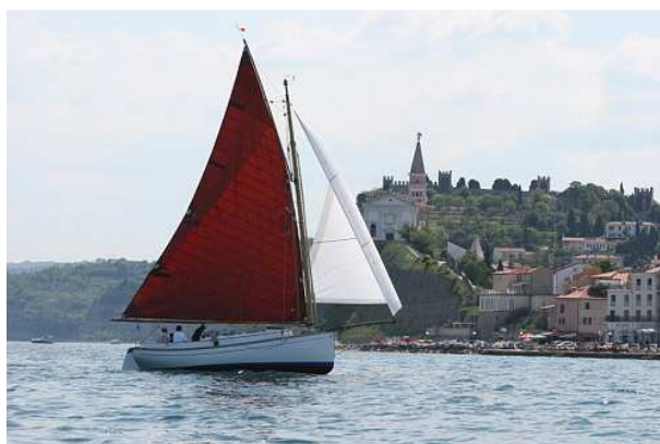
Pussycat in pre-partenza