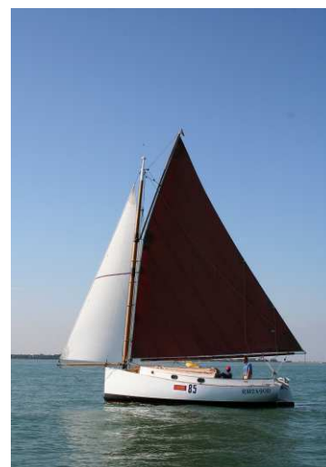
Margherita il cat che viene da lontano

l'occasione è stato ridotto il traffico navale in quel tratto di laguna. Chissà che sia l'inizio per riuscire a riappropriarci della laguna, ormai in mano alle barche per trasporto turisti che con il loro moto ondoso, sono il flagello principale per la nostra splendida Venezia. Classifica scarna per la categoria catboat, solo tre gli arrivi.