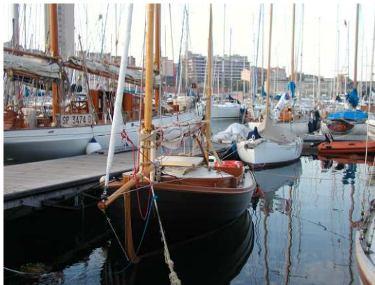
Kitty Hawk all'ormeggio