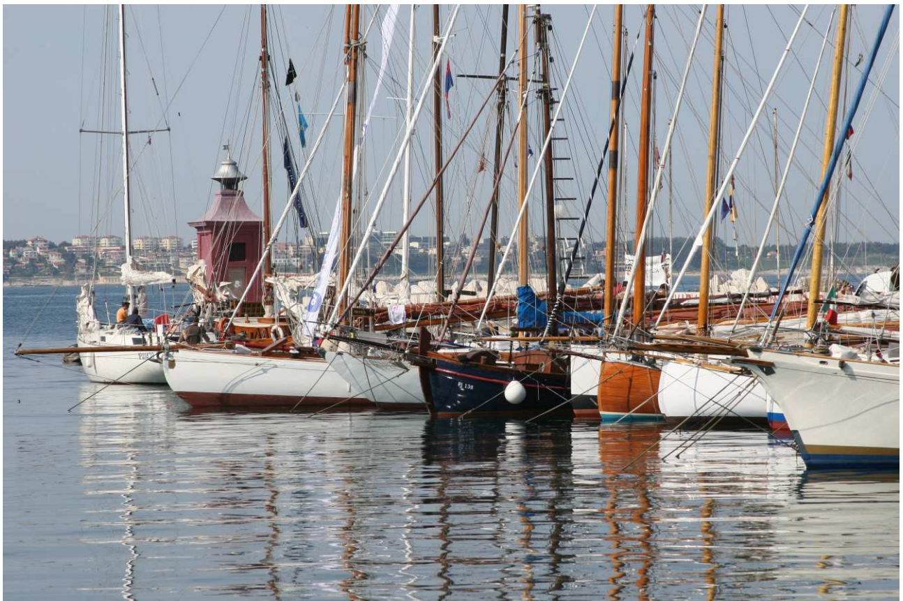
Le barche partecipanti all'ormeggio