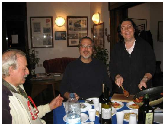
La "first Lady", il v. Presidente ed il Presidente al D.V.V.