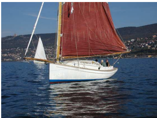
Pussycat in bonaccia