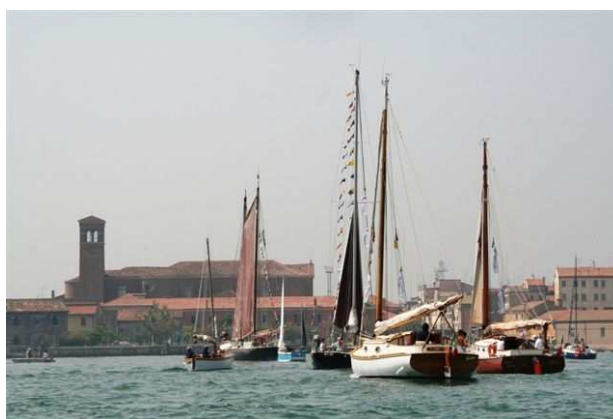
In rotta per Sottomarina

Vista la splendida festa, spero che per il prossimo anno ci sia anche qualche altro cat oltre a Mili e Cassiopea.