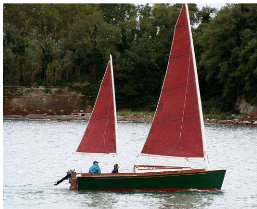
Siton... senza parole!

Anche quest'anno, per il nostro raduno, siamo stati ospiti al Diporto Velico Veneziano, partecipando anche alla ormai famosissima "Regata dei Miti".